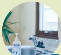
キッチンで シュッ