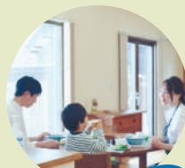
リビングで シュッ