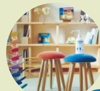
子ども部屋で シュッ