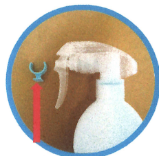
水色のストッパーが 取り外せるタイプのもの